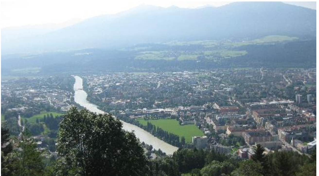
Willkommen in Innsbruck